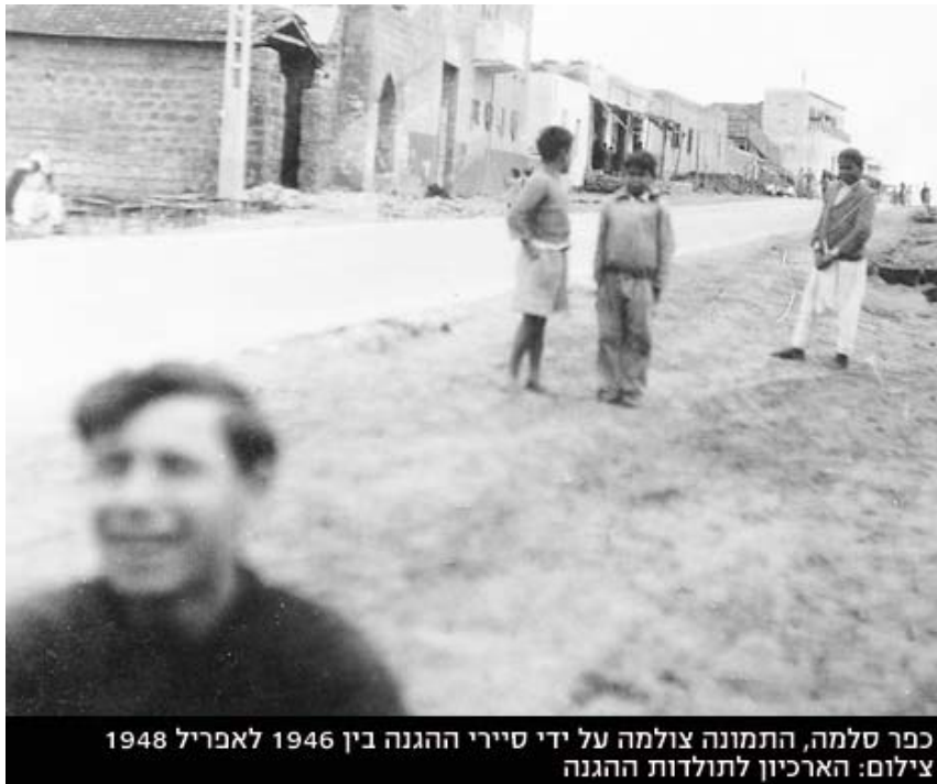
כפר סלמה, התמונה צולמה על ידי טיירי ההגנה בין 1946 לאפריל 1948 צילום: הארכיון לתולדות ההגנה

קונפליקט לאומי מוליד לעתים מצבי תעתוע והיפוך משמעויות, והיסטוריה של אחד הופכת להיסטוריה של האחר. היסטוריה "חדשה" זו מעמידה למבחן את כוחה הפנימי, עוצמתה וחוזקה של החברה הישראלית, הנקראת להתמודד עם עברה. האם ימצא הגורם שיסכים לממן הוצאת לקסיקון מקיף של הכפרים, הנשען על החומרים הללו? האם תעמוד לחברה הישראלית גם כאן אותה תעוזה המפארת את דפי היסטוריה הרשמית?*