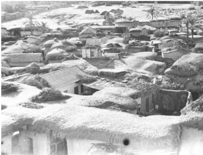
הכפר אסדוד (אשדוד), צולם ממגדל של מסגד, שנות ה-40 של המאה ה-20

"כל הזמן היו מעקבים, חיפושים וחקירות, ואנחנו מצדנו שיכללנו את שיטות הסליקים, ההטעות ו'סיפורי הכיסוי'. כמו 'טיסת אימון ניווט מיוחדת' או 'טיסת לימוד מיוחדת' וכדומה, דברים שהיו אמורים להסביר כל מיני 'לולאות' טיסה משונות וסיבובים שעשינו למעשה לביצוע הצילומים. נהגנו פה ושם לטוס גם מעל יישובים יהודיים כדי להטעות את הבריטים. לא תמיד זרקנו את הסרטים בנען. לעתים, בשל שיקולים שונים החבאנו אותם בסליק שבמטוס והיינו זורקים אותם בפעם הבאה, או שהשארנו כמה טייסים לשעות הערב המאוחרות, לכאורה לטיפול במטוסים, ואז - לאחר שהבלשים המיוחדים הלכו לשתות בירה ולנוח - היציאה היתה יותר פשוטה. לפעמים היה הבחור עם הסרט יוצא מהבסיס באוטובוס ערבי, שהיה חשוד פחות, נוסע איתו ליפו, משם לתל אביב, משם לרחובות ומשם מגיע לנען ברגל! כל תרגילי הטשטוש וההתחמקות היו הגיוניים".