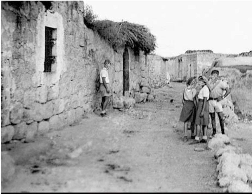
טיירי ההגנה בפעולה, מתוך תיק הכפר של אל-קובב, 1947. בני הטיירים טושטשו כדי למנוע את זיהויים