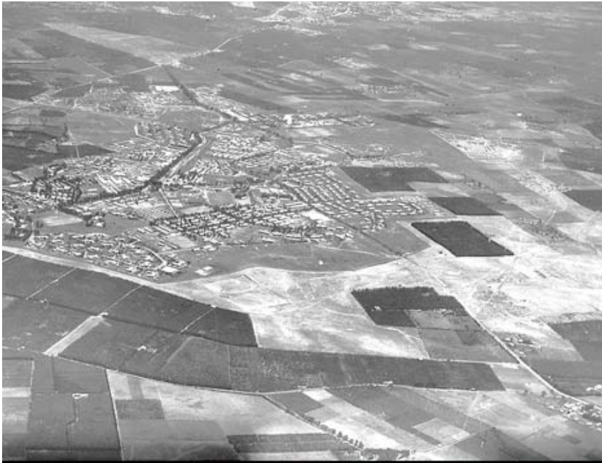
צילום אוויר של היישוב הערבי סרפנד, ליד רמלה, 1947 בקירוב