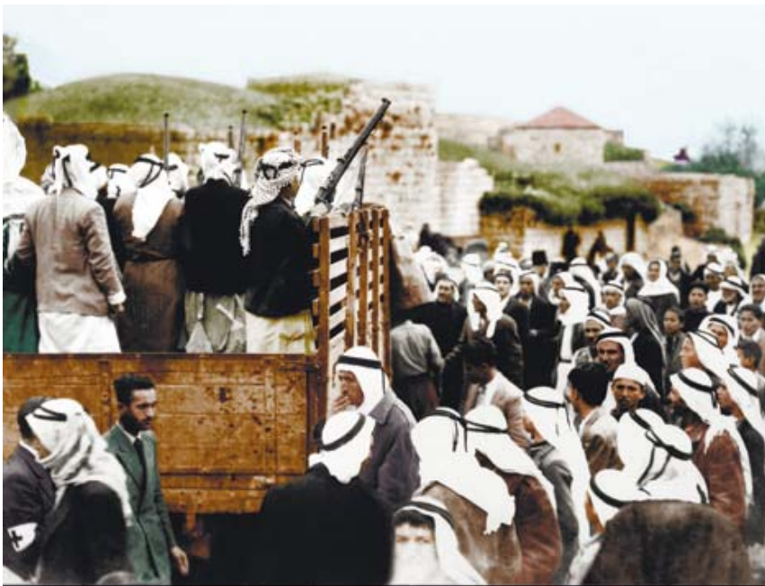
לוחמיו של עבד אל-קאדר אל-חוסייני יוצאים לקרב לכיבוש הקסטל, אפריל 1948

העוז והגבורה התעצמו כאשר החליטו לצלם את הכפרים מהאוויר להשלמת המידע בתיקים. נולדו דרכים מתוחכמות להערים על הבריטים שאסרו פעילות כזאת. הם התחילו לצלם את הכפרים במסווה של מועדון תעופה ושל טיולים אוויריים רומנטיים, שיכללו את האופנים שבהם הוחבאו המצלמה והנגטיבים במטוס ובסביבתו והמציאו אמצעים חדשים לאיסוף מידע באופן חשאי. נשים קיבלו תפקיד משמעותי בתהליך ההסוואה והצילום ואחת מהן שימשה, ככל הידוע עד כה, צלמת האוויר הראשונה שפעלה בארץ.