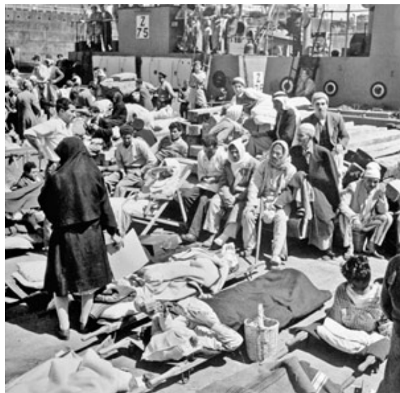
פצועים ערבים על הרציף בנמל חיפה, 1948. גופות רבות נשאר באזור השוק המופצץ

במועדון הקשישים בשכונת ואדי ניסנאס בחיפה, אי אפשר להתייחס להיסטוריה כאל תעמולה. בשביל עשרות הקשישים