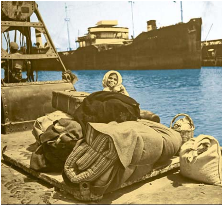
ילדה ערבייה על הרציף בנמל חיפה, אפריל 1948. פצצות המרגמה של ההגנה זינבו בנמלטים